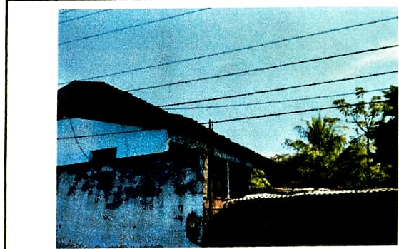
Foto 2: Sustrucción de lámina por lámina troquelada aluzinc calibre 26 y Mantenimiento a estructura de soporte de metal