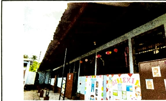
Foto 1: Sustrucción de lámina por lámina troquelada aluzinc calibre 26 y Mantenimiento a estructura de soporte de metal